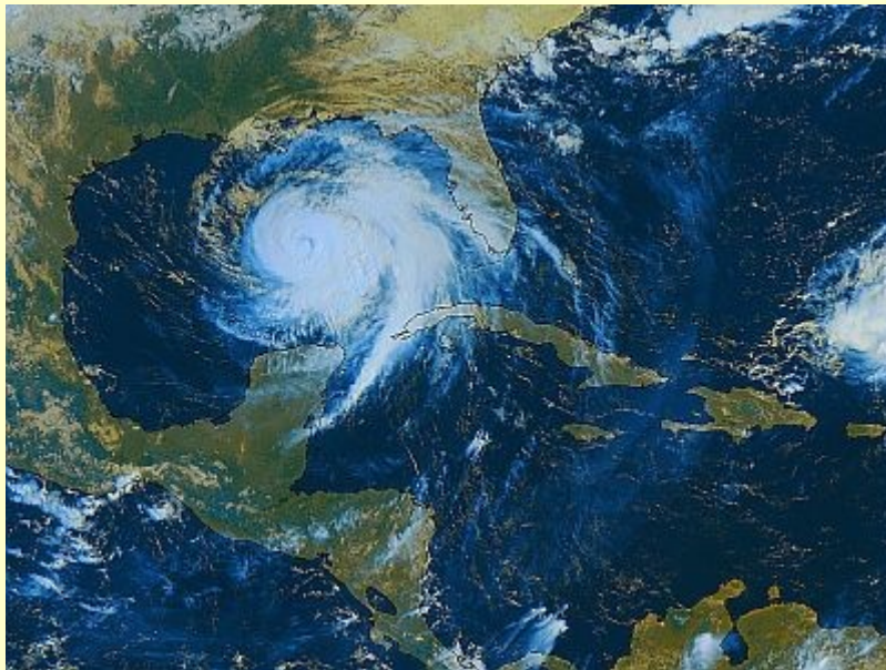
Image Satellitaire du 11/09/2008 à 14h30 UTC - Satellite Goes 12 - Composition colorée (réf.2009D00935).

Pour contacter la librairie par courriel : librairie-alma@meteo.fr